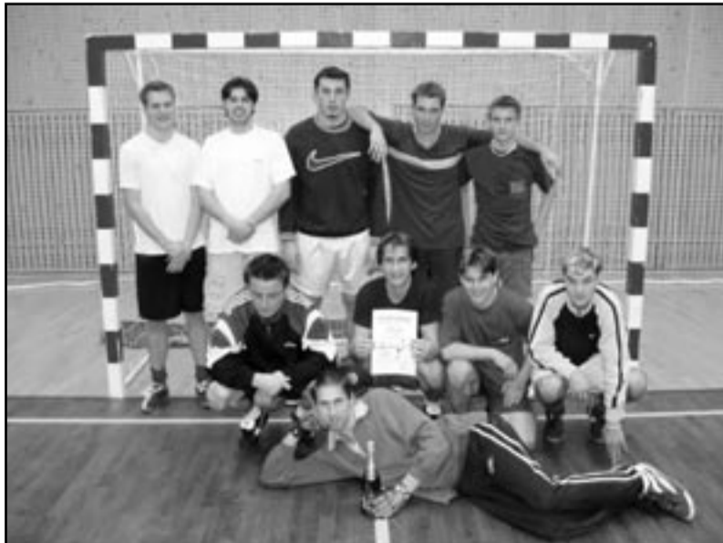
Foto : Vítězné družstvo zimního turnaje v sálové kopané

Skupina B - pořadí : 1. Moravec Zbraslavice 8-5 7 b. 2. Kovo Ledec n.S. 5-2 7 b. 3. Star Chabeřice 5-3 6 b. 4. Volejbal Zruč n.S. 5-7 4 b. 5. I.FC Fekon Horka n.S. 3-8 2 b.