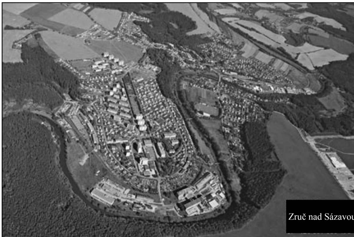
Zruč nad Sázavou

Oddělení kultury i redakční rada Zručských novin děkují za vánoční přání a hlavně za všechna upřímná přání všeho dobrého do nového roku.