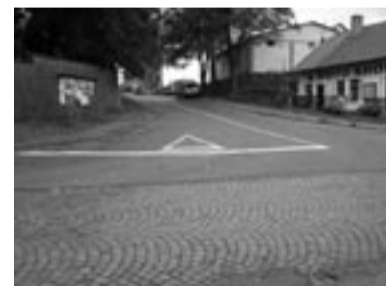
Foto : Nové vodorovné dopravní značení v našem městě má napomoci bezpečnějšímu provozu. Bohužel mnoho řidičů právě na této křižovatce dopravní předpisy stále porušuje a „čáry“ na vozovce jakoby pro ně neexistovaly.