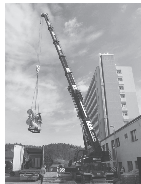
Nová technologie do naší kotelny