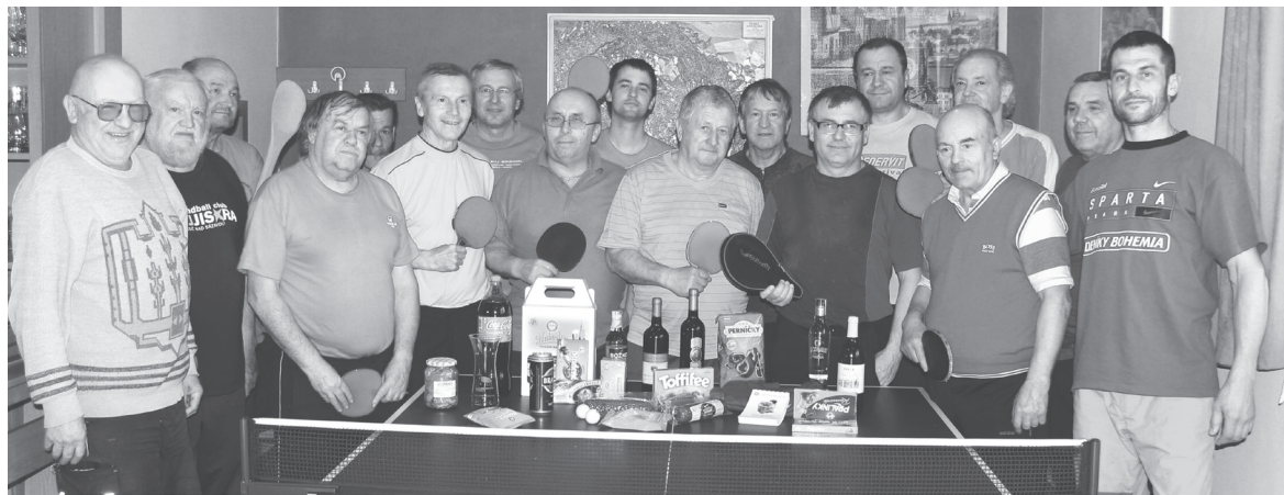
Účastníci závěrečného sedmého turnaje neregistrovaných převzali po finálovém utkání věcné ceny.

První dva z každé skupiny postoupili do skupiny o 1.–8. místo, druzí dva hráli ve skupině o 9.–16. místo. Hrál se klasický „pavouk“.