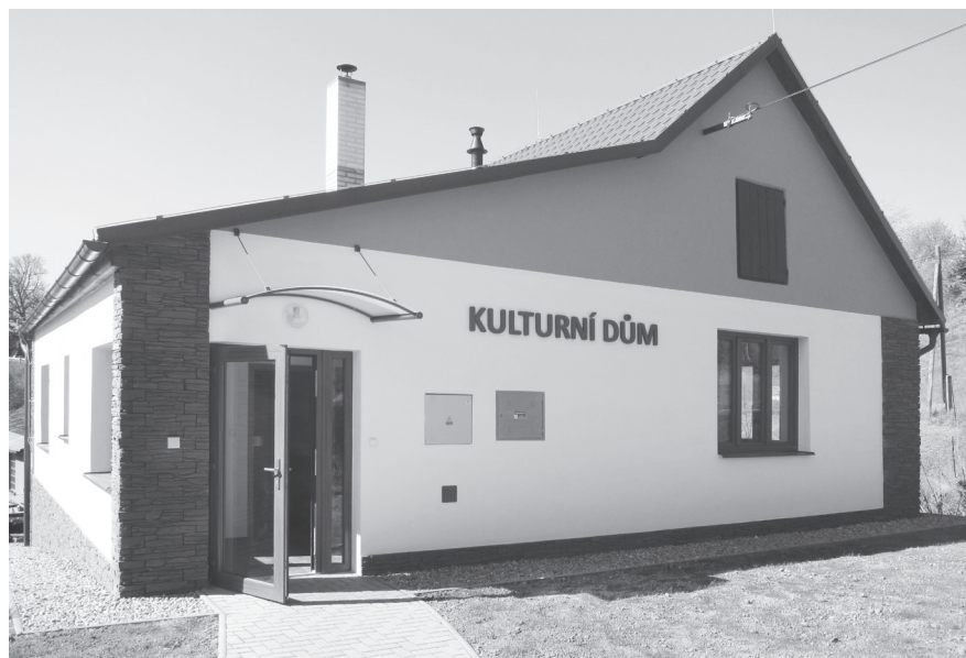
Kulturní dům na Dubině otevřen