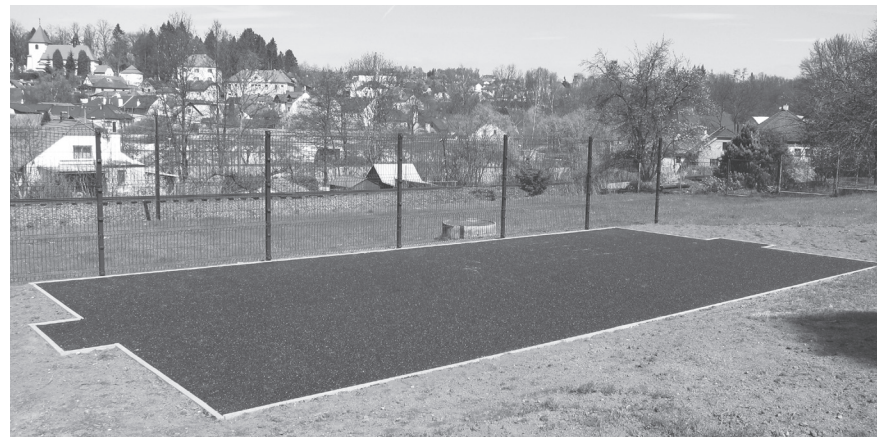
Malé víceúčelové hřiště na zahradě MŠ Malostranská ve výstavbě