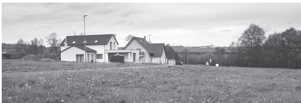
Prodej parcel v lokalitě Nad Ovčínem

Městu zbývají k prodeji pouze čtyři parcely v lokalitě Nad Ovčínem. Tři, každá o výměře 1 085 m 2 , nad silnicí a jedna parcela o výměře 1 133 m 2 pod silnicí. Prodejní cena pozemku je 750 Kč/m 2 . Více informací o parcelách naleznete na webových stránkách města nebo u pana Petra Malého, tel.: 327 531 235, e-mail: maly@ mesto-zruc.cz.