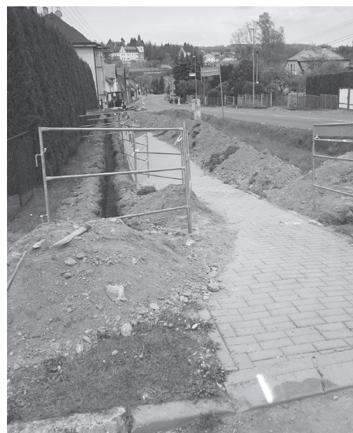
Elektrické kabely budou uloženy do země v ulici Vlašimská a Říční.

Noví zájemci o studium na Základní umělecké škole ve Zručí nad Sázavou mohou přijít s rodiči na přijímací talentové zkoušky ve dnech: 26. května (všechny obory od 14 do 17 hodin), 21. a 22. června (výtvarný, taneční, literárně-dramatický obor od 15 do 18 hodin) a 27. a 28. června (hudební obor od 14 do 17 hodin).