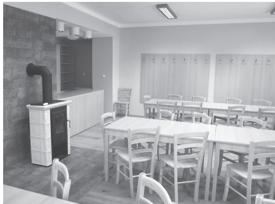
Interiér kulturáčku na Dubině