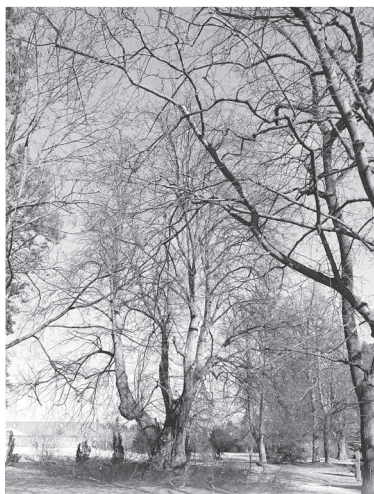
Ošetření Kalenické lípy v parku