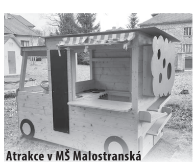
Atrake v MŠ Malostranská