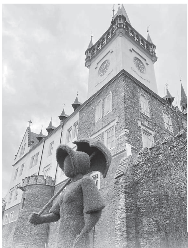
Nová socha baronky na parkánu