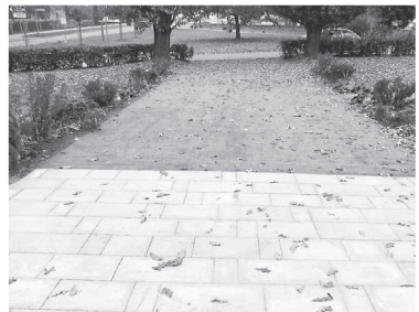
U památníku na Malostranském nám. Plocha po realizací (Drobnosti)

Město buduje plynové přípojky k provozovněm v horní části Zručského dvora. Práce provádí firma Výstavba sítí Kolín za cenu 306 tisíc korun.