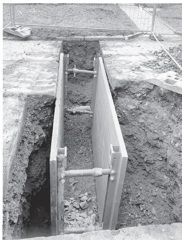
Kanalizační přípojka v Okružní ulici