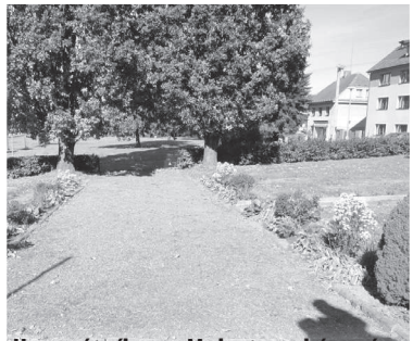
U památníku na Malostranském nám. Plocha před realizací (Drobnosti)