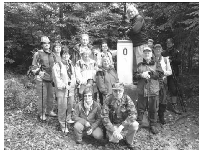
Přijďte mezi nás! Zdraví došli!