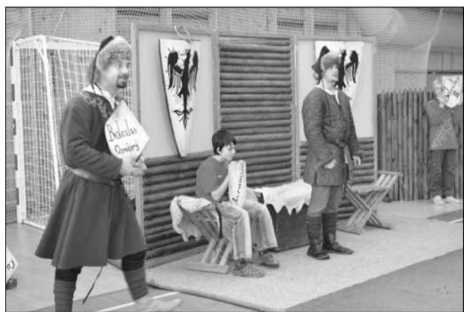
Vzdělávací pořad - Přemyslovci - 4. 11. 2013