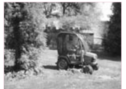
Foto: Boj se zelenou záplavou v parku