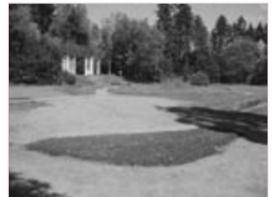
Park bez pařezů

Po zimním kácení v parku a na náměstí MUDr. Svobody došlo k odstranění pařezů. Odborná firma odfrézovala všechny pařezy.