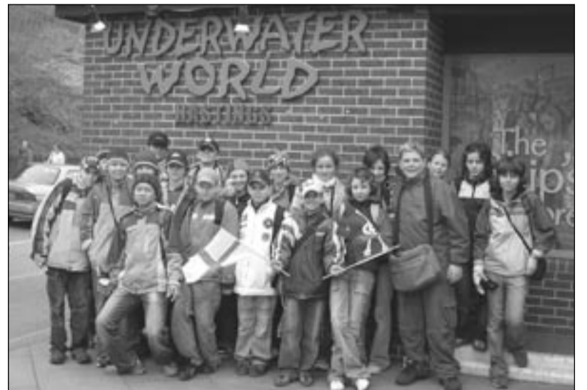
Foto: Prohlídka podmořského světa

Přihlásilo se tento rok méně dětí, a proto jsme cestovali v luxusním patrovém autobuse ještě s výletníky z Pacokova a Teplíc. Nakonec nás byl plný autobus, asi 66 dětí a několik dospělých jedinců, kteří dozorovali.