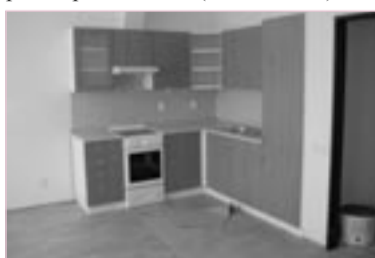
Foto: Dům s pečovatelskou službou - kuchyňská linka

Před dokončením je stavba 16 bytů pro seniory a 4 bytů pro mladé za hotelem. Město již obdrželo letošní dotaci ve výši 4,14 mil korun. Samotná stavba bytů finišuje a na konci května začnou práce na úpravě okolí – jedná se především o pokládku zámkové dlažby. S nastěhováním nových nájemníků se počítá na konci prázdnin nebo v průběhu měsíce září. Informace zájemcům podá Správa budov (327531416).