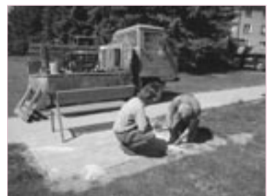
Foto: Montáž nových laviček

Technické služby začaly s letošní instalací nových košů a laviček. Sad Míru je již hotov. Výměna laviček proběhne v celém městě mimo parku. V parku budou vyměněny poškozené lavičky za stejné - zachovalé.