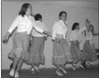
Country tance v podání dětí ze ZŠ Kácov