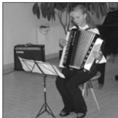
Foto: S. Brtnová ze třídy R. Bělohorského na absolventském koncertě