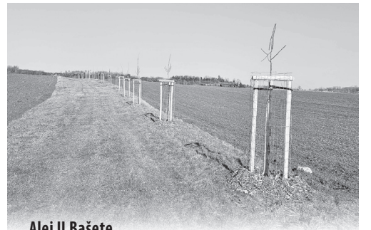
Alej U Bašety

VIZE NAŠÍ ŠKOLY Učíme se pro život, s individuálním přístupem a důrazem na pozitivní vztahy