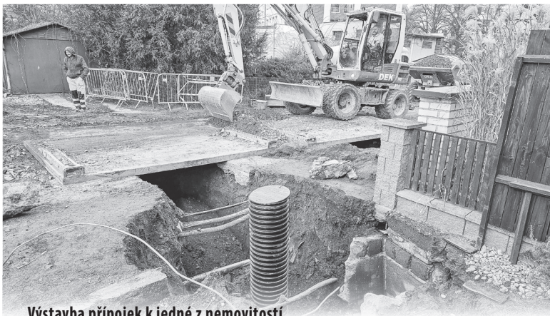
Výstavba přípojek k jedné z nemovitostí