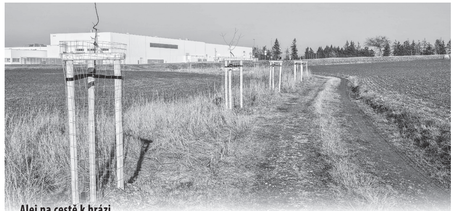
Alej na cestě k hrázi