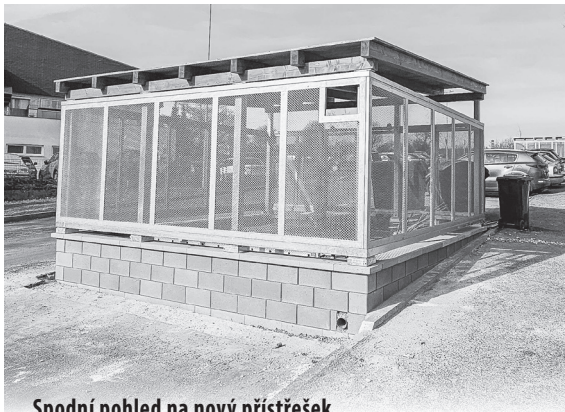
Spodní pohled na nový přístřešek