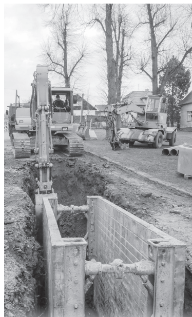
Výstavba kanalizace v Zahradní ul. 2012