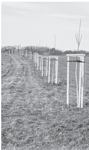
Výsadba zeleně 2013–2025