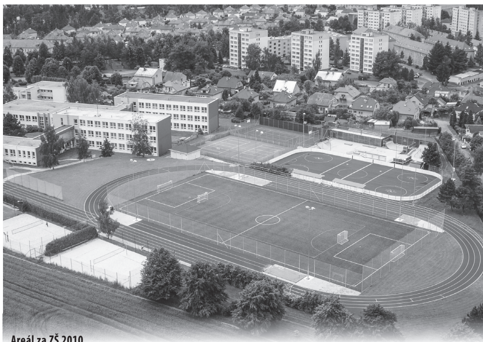
Areál za ZŠ 2010