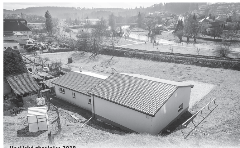
Hasičská zbrojnice 2018