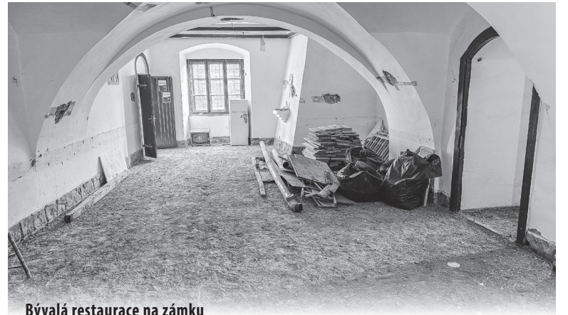
Bývalá restaurace na zámku