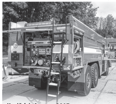
Hasičská cisterna 2017