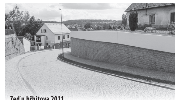
Zeď u hřbitova 2011