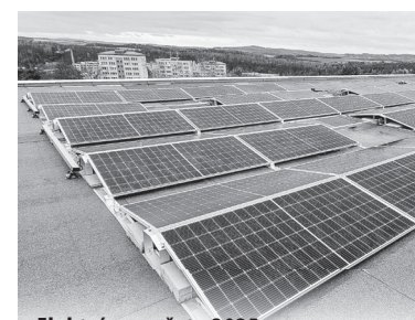
Elektrárny města 2025