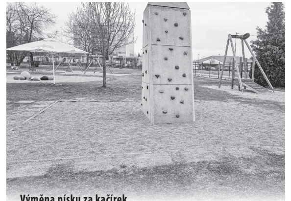
Výměna písku za kačírek