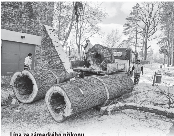
Lípa ze zámeckého příkopu