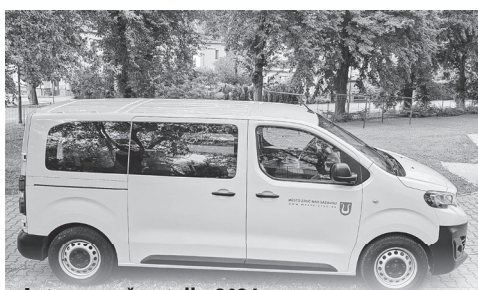
Auto pro pečovatelky 2024