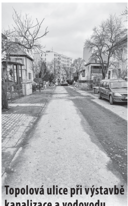
Topolová ulice při výstavbě kanalizace a vodovodu