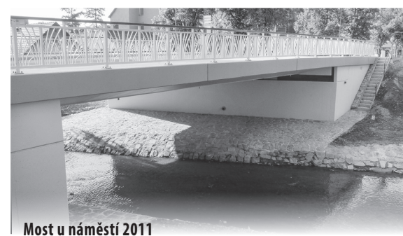
Most u náměstí 2011