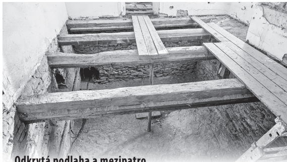
Odkrytá podlaha a mezipatro