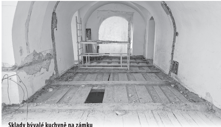
Sklady bývalé kuchyně na zámku