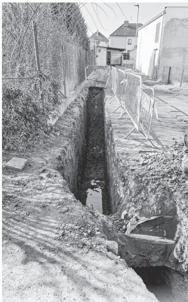
Budování kanalizační přípojky k házené