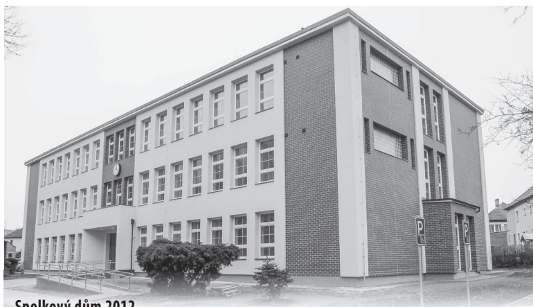
Spolkový dům 2012