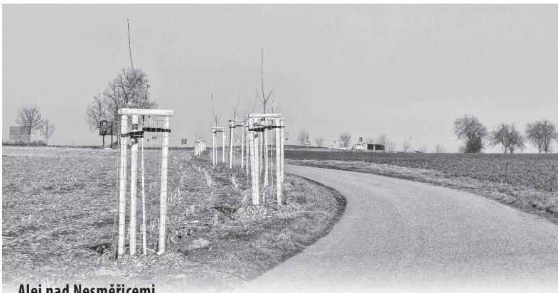
Alej nad Nesměřicemi