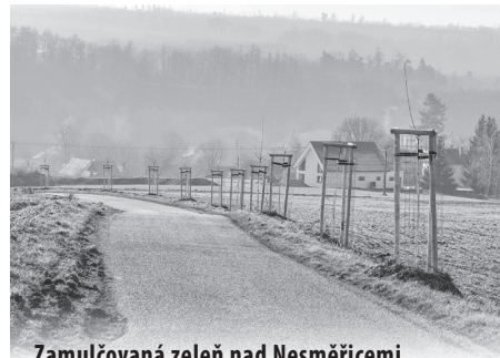
Zamulčovaná zeleň nad Nesměřicemi