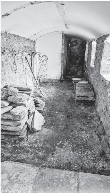
Odkrytá podlaha chodby u nádvoří zámku