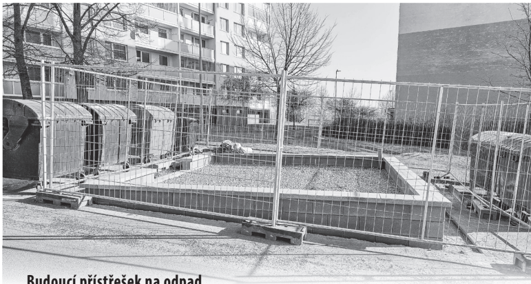
Budoucí přístřešek na odpad