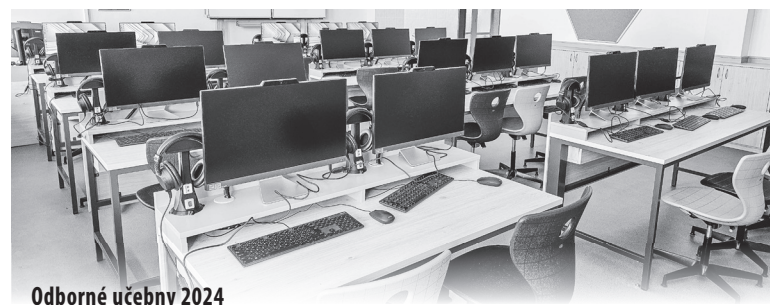
Odborné učebny 2024