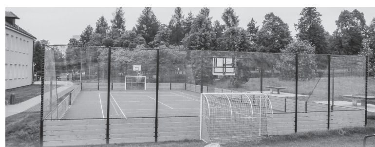
Zručská hřiště oživají u školní jídelny 2015