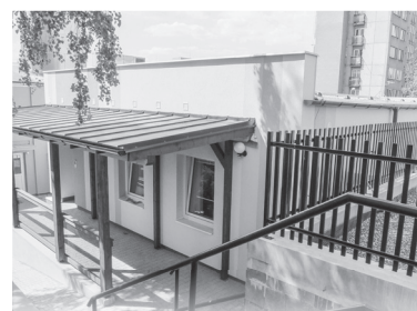
Nízkoprahový klub Kotelna 2011